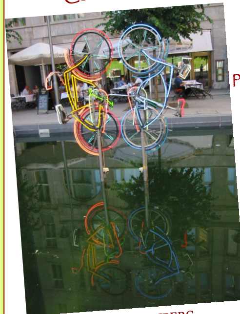
Robert RAUSCHENBERG -